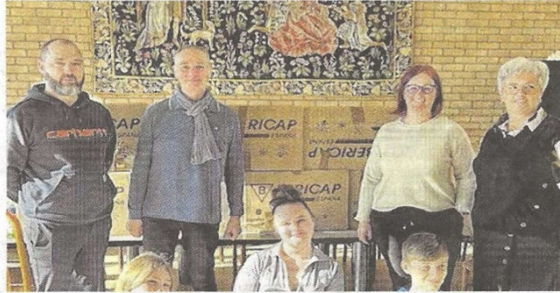
8 cartons et beaucoup de générosité

« Nous planifions un conseil tous les trois mois, comme les adultes, et nous demandons aux enfants quelles actions ils souhaitent mener. Cette col-